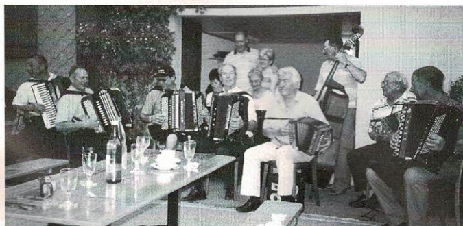
Musikanten sorgten den ganzen Tag für gute Stimmung.